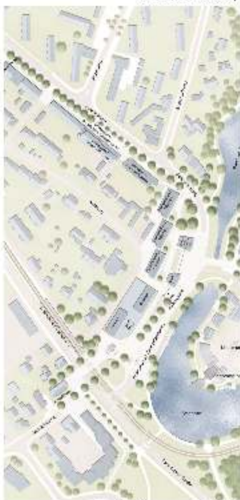
Vennhofallee Nutzungsplanzone M 1:1000