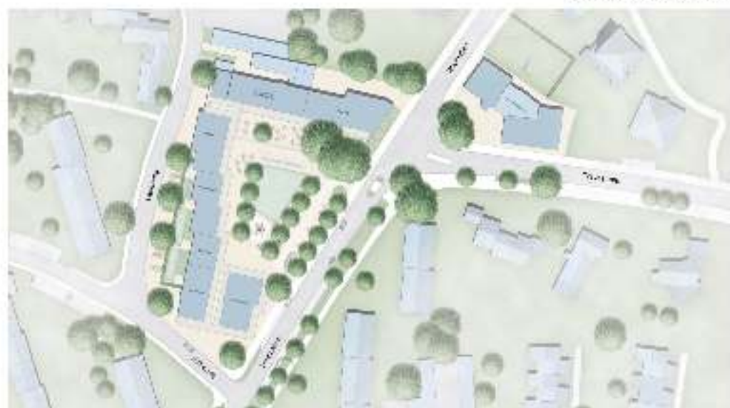
Florallee Legation M 125