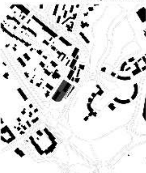
Vennhofallee Schwarzwälder M 1:2000