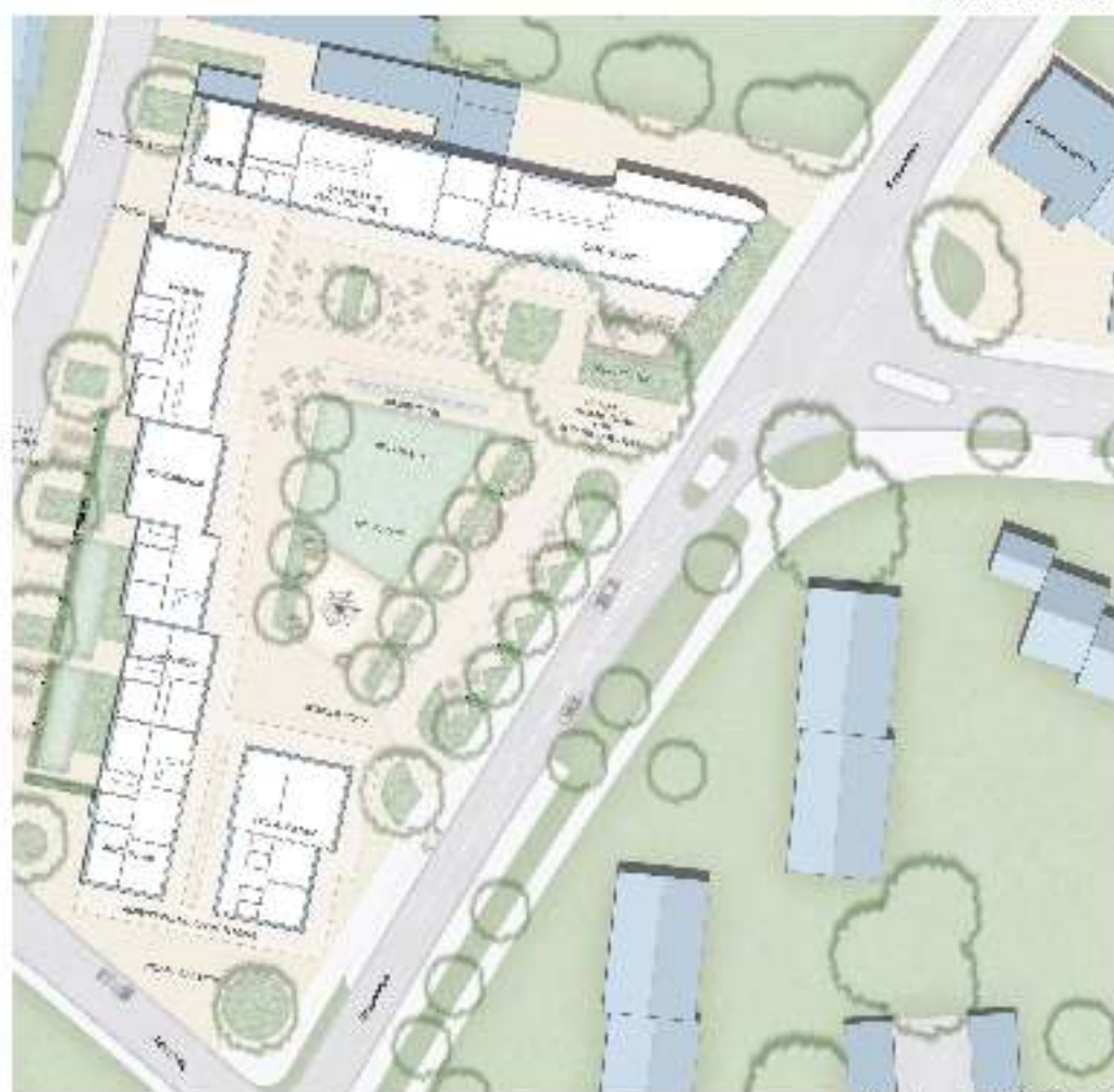
Florallee Grundbesitz EGM 125