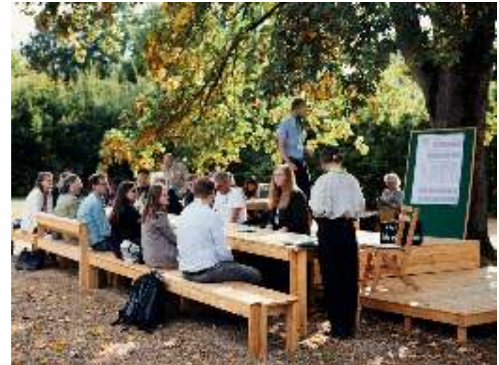
September 2022