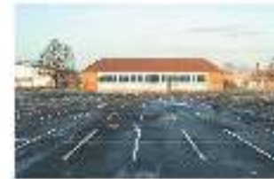
Block 9 Turnhalle Nutzung für Sport