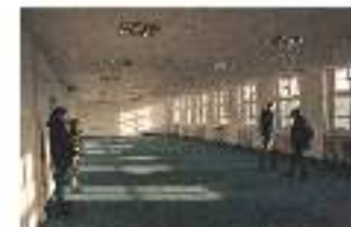
Block 10 Mensa Nutzung für Lager/storage Nutzung für Werkstätten/workshops (Hair & Dress)